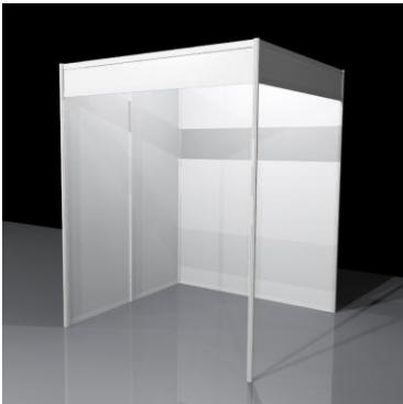
Valmisosasto A otsalaudalla (kuvassa koko 4 m 2 )

Pienin osasto, jonka voi jakaa kahdelle, on 6 m 2 . Pöytäpaikka on tarkoitettu vain yhdelle näytteilleasettajalle.