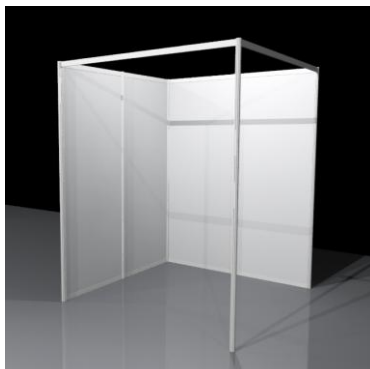
Valmisosasto B tukirakenteilla (kuvassa koko 4 m 2 )